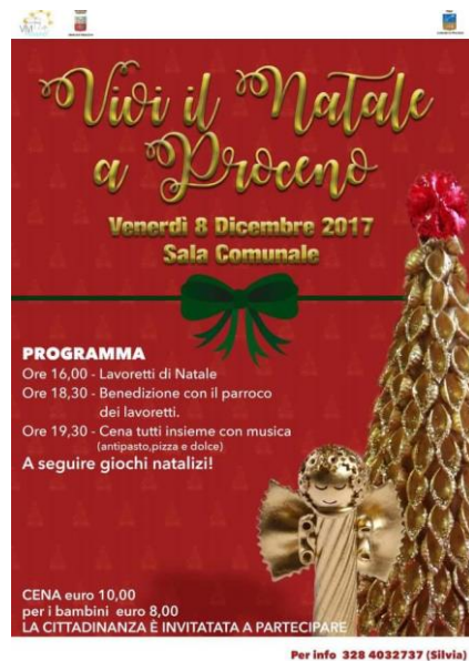
Manifesto terza edizione

“Vivi il Natale a Proceno”, nella sua quarta edizione, si amplia quest’anno in maniera innovativa con il recupero delle proprie tradizione artigianali, riportando Proceno e i Procenesi al Museo del paese, con la pianificazione dei “Degustibus invernali: Notti al Museo”.