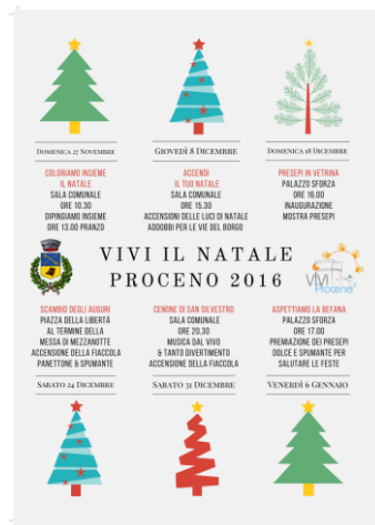
Manifesto seconda edizione

“Vivi il Natale a Proceno”, nella sua terza edizione, si amplia quest’anno in maniera innovativa con il recupero delle proprie tradizione artigianali, riportando Proceno e i Procenesi al Museo del paese, con la pianificazione dei “Degustibus invernali: Notti al Museo”.